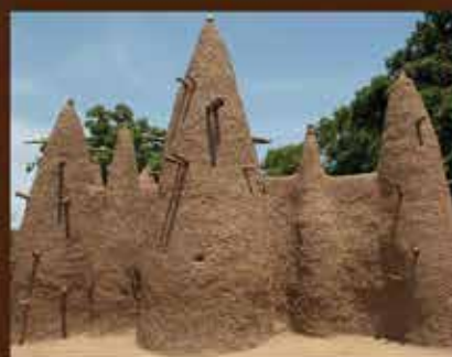
MOSQUÉE DE NAMBIRA