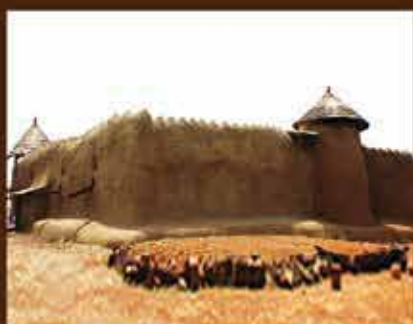
MOSQUÉE DE SAMATIGUILA