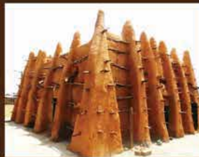
MOSQUÉE DE SOROBANGO