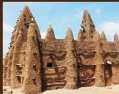
PETITE MOSQUÉE DE KONG