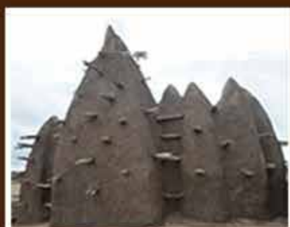
MOSQUÉE DE KAOUARA