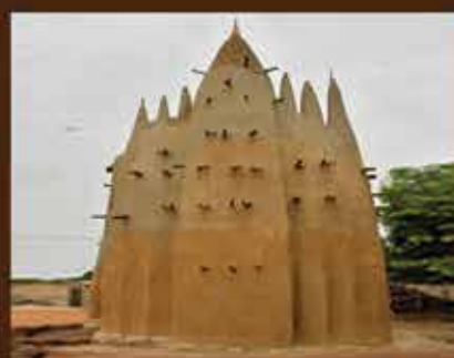
MOSQUÉE DE TENGRÉLA