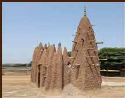
MOSQUÉE DE KOUTO